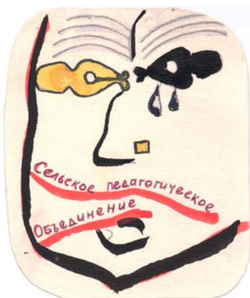
«Эмблема» практикантов-филологов НГПИ на практике в Пашино, 1971 г.