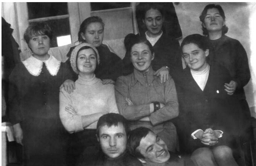
На педагогической практике в Пашино, 1971 г.