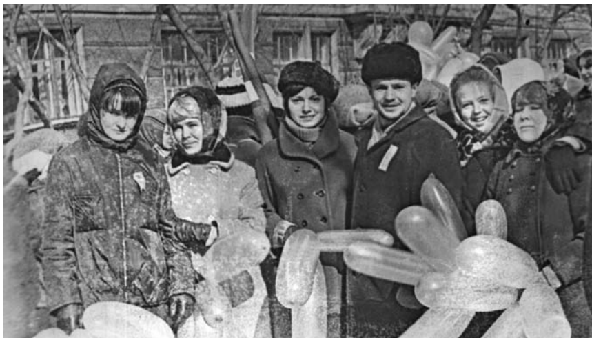
Наша группа на демонстрации в 1969 г.

Иногда во время занятий вели своеобразную игру-переписку. Сочиняли, какой-нибудь образ, метафору, сложную замысловатую рифму, стараясь перешеголять друг друга. Однажды он сразил меня наповал, показав строчки: «...Пахнущая дождиками бочка на ветвях серебряных висит...» Мне сразу стало грустно, и все мои сочинительские потуги показались смешными и никчемными. Но когда я попросил прочесть все стихотворение, он как-то ушел от ответа. Позднее читал всего лишь четверостишие, связанное с этими строчками, но почти всякий раз новый вариант.