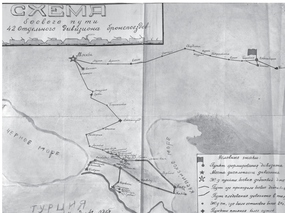
Боевой путь 42-го ОДБП. ЦАМО. Ф. 38. Оп. 11358

...41-й отдельный Дивизион Бронепоездов начал формирование 13 декабря 1941 года в гор. Новосибирске. Личный состав д-на был набран через РВК преимущественно из рабочих гор. Новосибирска, Прокопьевска, Кузнецка и Болотной. К 1 февраля 1942 г. дивизион был полностью укомплектован личным составом.