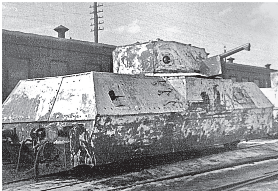
Бронеплощадка бронепоезда «Железнодорожник Кузбасса».

6—8 марта 42 года дивизион получил материальную часть: бронепоезда «Сибиряк», построенный рабочими железнодорожниками депо станции Бело-