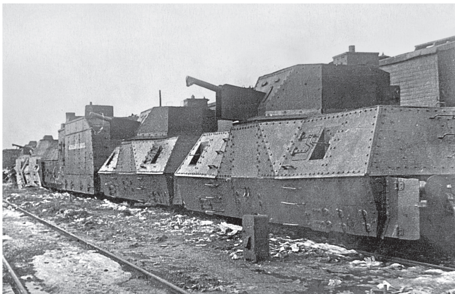
Бронепоезд «Металлург Кузбасса». ЦАМО. Ф. 38. Оп. 11358

во, и «Металлург Кузбасса», построенный рабочими станции Инская (тот случай, когда исторический формуляр содержит явную ошибку. — П. О.)